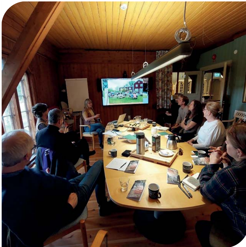
Figur 2. Dialogresa till Region västra Götaland. Möte på Nääs byggnadsvårdscentrum.