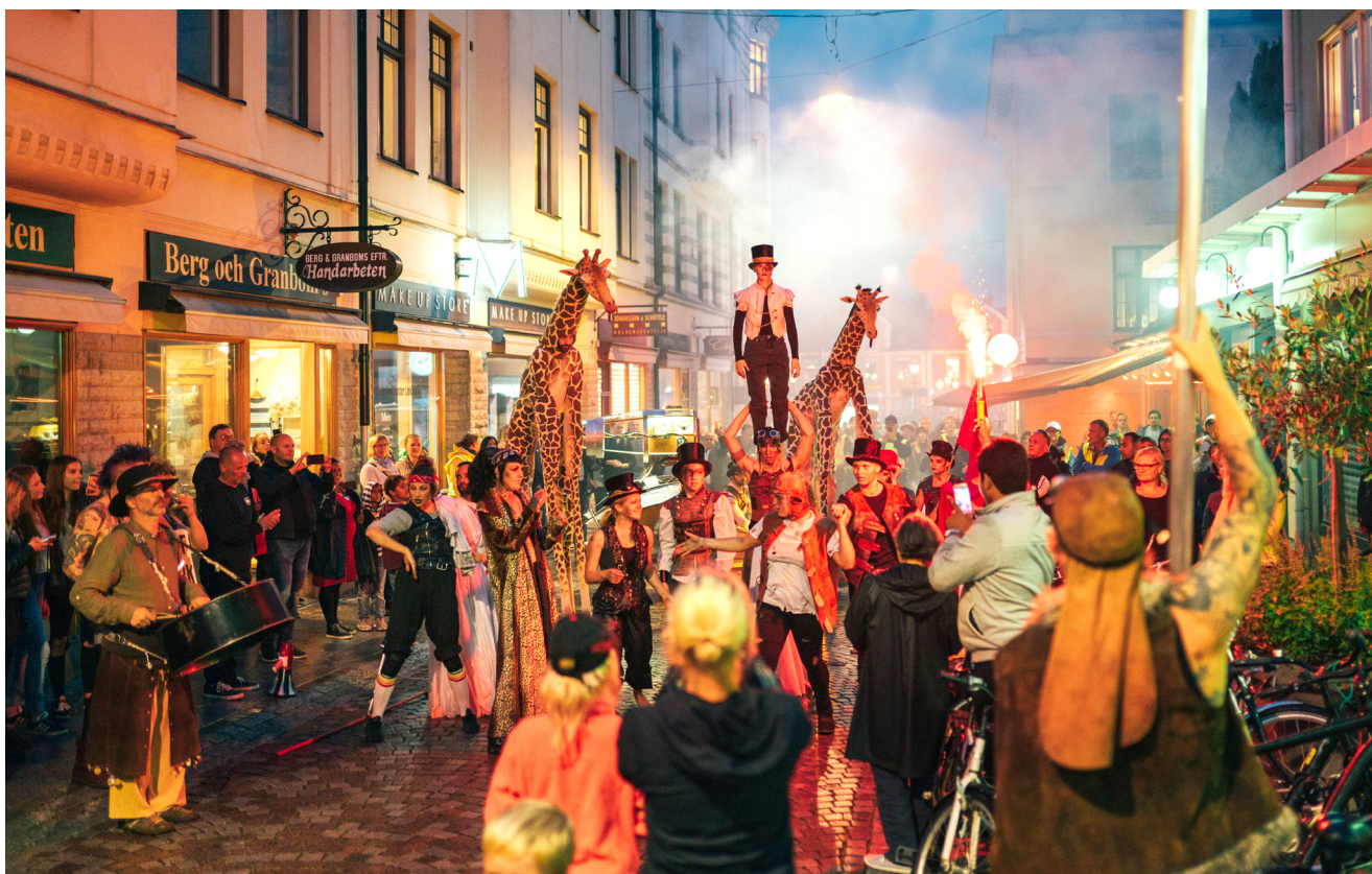
PARADEN GICK GENOM STADEN FLERA GÅNGER OM DAGEN UNDER DEN INTERNATIONELLA NYCIRKUSFESTIVALEN I LINKÖPING I AUGUSTI 2019.

På frågan ”Vad vill ni att det ska hända i framtiden?” svarar man att det är viktigt att nätverket bibehålls och att de satsningar som är igång kan fortsätta och stabiliseras och att det skapar arbetstillfällen för lokala aktörer. Man vill också ha fortsatta festivaler och att det skapas en plattform där man kan söka pengar för projekt.