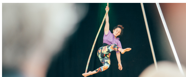
CIRKUS CIRKÖR I DEN NYA FÖRESTÄLLNING BLOOM, LINKÖPING 2019.