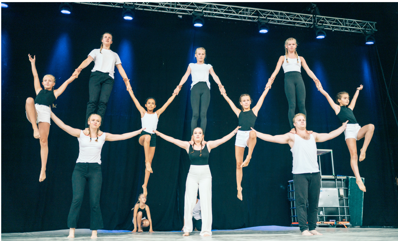
UNGDOMAR FRÅN NORRKÖPINGS UNGDOMSCIRKUS, NORRKÖPINGS CIRKUS & VARIETÉ SAMT LJUNGSBRO FRISKSPORTFÖRENING GAV SHOWEN POPUP UNDER FESTIVALEN I LINKÖPING 2019.

träning och residensverksamhet; Utbyten mellan ungdomscirkusarna; Samarbeten kring kompetensutveckling och rekrytering av tränare; Verka för etablering av såväl gymnasial som eftergymnasial cirkusutbildning i regionen; samt Medlemsrekrytering och finansiering. Andra frågor som identifieras som viktiga är att verka för ett större utbud av cirkusföreställningar i regionen, arbete med arrangörsutveckling, undersöka hur vi ska kunna ta emot fler barn och unga i träning, utveckla samarbeten med fritidsgårdar och hur skapa fler workshops och läger.