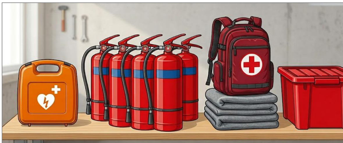
Figur 1 Bilden är AI-genererad och ger en fingervisning om paketets innehåll som kan komma att justeras under upphandlingsförloppet.

Vi har räknat med att alla 40 öar/områden som är med i projektet kommer att tilldelas ett ”baspaket” för att kunna ingripa snabbt i händelse av hjärtstopp, brand eller sårskador. Paketets värde uppgår till cirka 30 000 kronor. Baspaketet innehåller 1 hjärtstartare, 5-6 pulverbrandsläckare och en väska utrustad med sjukvårdsmaterial anpassad för den här geografien.