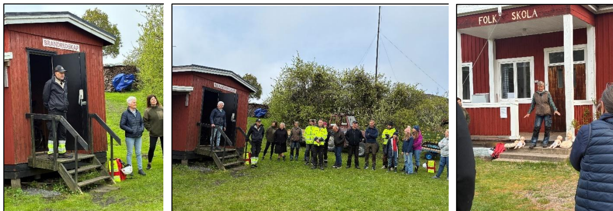
Figur 3 Bilder från Harstenabesöket den 15 maj.