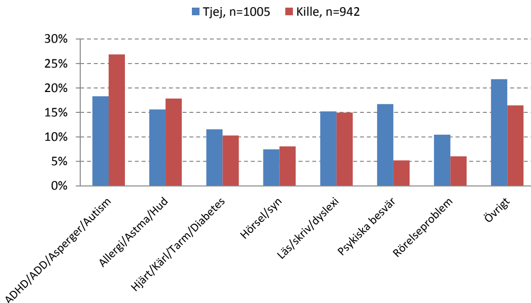
Figur 2. Grupper av funktionsnedsättning och sjukdomstillstånd per kön. Data från Om mig 2014, 2015, 2016.

Ungdomar som uppger funktionsnedsättning eller sjukdom har sämre generell hälsostatus och sämre tillgång till riktigt bra kompisar jämfört med ungdomar som inte uppger funktionsnedsättning eller sjukdomstillstånd.